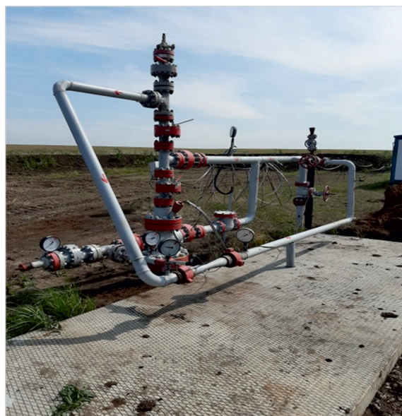
Рис. 1. УСУ в устьевой обвязке скважины