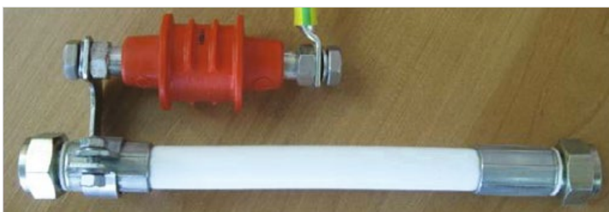
Рис. 1 — Установка диэлектрической вставки ВДГ перед узлом управления шаровым краном и ее шунтирование искровым разрядником EXFS 100