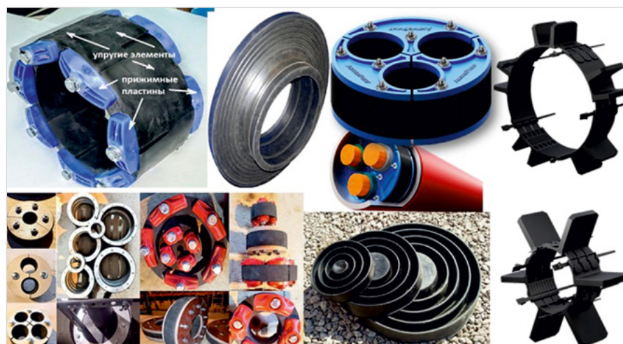
Рис. 2. Материалы для герметизации проходов труб и протяжки труб в футлярах

ООО «АПС» производит ассортимент материалов для герметизации проходов труб/кабелей, предназначенных для предотвращения течей через указанные зазоры (рис. 2).