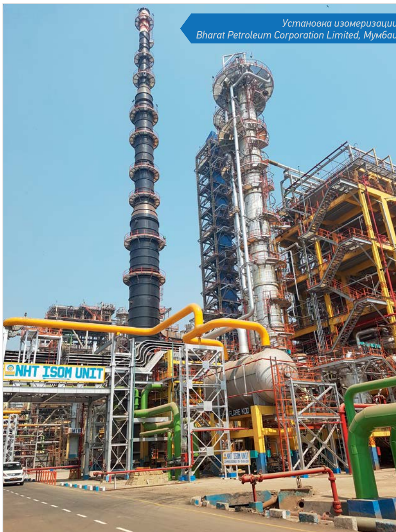
Установка изомеризации Bharat Petroleum Corporation Limited, Мумбаи

заседании рабочей группы при поддержке УК «Роснано». По результатам рассмотрения было принято решение о присвоении статуса национального проекта «Создание отечественной технологии каталитического риформинга с непрерывной регенерацией катализатора для производства высокооктановых автобензинов». План реализации был утвержден приказом Минэнерго №89 от 9 февраля 2017 года и предусматривает разработку и коммерциализацию данного проекта в России и за рубежом в течение последующих 5–8 лет. При этом катализатор для процесса риформинга с непрерывной регенерацией уже готов к своему первому внедрению. Его промышленное производство полностью налажено на собственной катализаторной фабрике ООО «НПП Нефтехим» в Нижнем Новгороде. Катализаторы серии