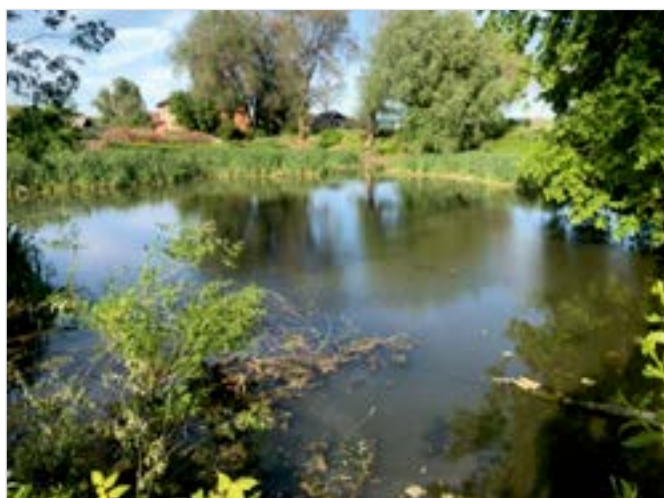
Рис. 7. Вид на пруд в Томашевом Колке Fig. 7. The view of the pond in Tomashev Kolok