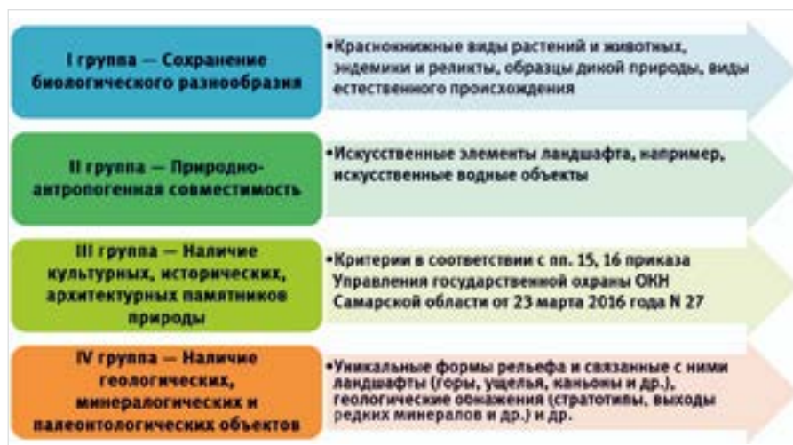
Рис. 5. Система критериев выделения ООПТ местного значения Fig. 5. The system of criterias for allocation of SPNT of local significance

Количество ООПТ местного значения не может быть регламентировано, поскольку административные районы имеют различные размеры. Однако число ООПТ не должно быть слишком маленьким (недостаточно проработана территория) или слишком большим (негативные последствия с экономической точки зрения). Поиск и обоснование