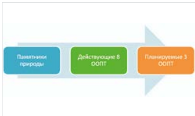
Рис. 3. Существующая сеть ООПТ г. о. Самара Fig. 3. The existing network of SPNT in Samara