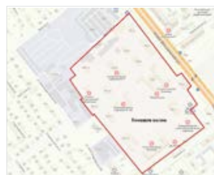
Рис. 6. Местоположение исследуемых объектов Fig. 6. Location of the studied objects