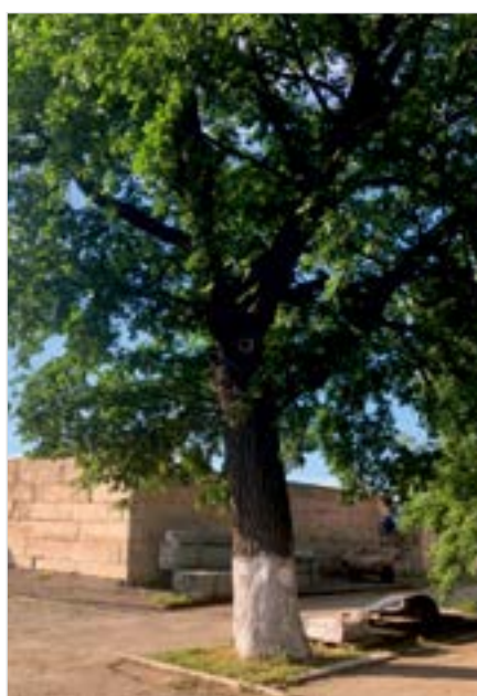
АХЧ № 2 ANCH №2