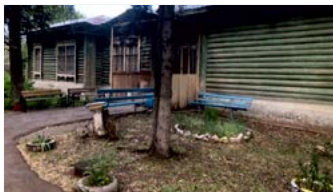
Рис. 8. Территория объекта Томашев Колок Fig. 8. The territory of the object Tomashev Kolok