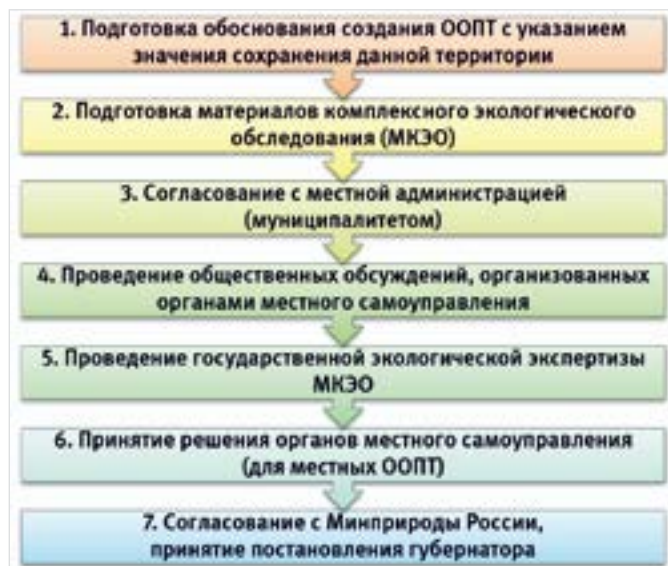
Рис. 1. Основные этапы создания ООПТ местного значения Fig. 1. Main stages of creation of SPNT of local significance

Процесс создания ООПТ местного значения сложный и длительный. Необходимо изучить схему территориального планирования региона (перечень существующих и планируемых к созданию ООПТ). Если планируемая к созданию территория уже туда включена, то нужно только ускорить процесс ее создания (потребовать обозначения конкретных сроков создания ООПТ или резервирования земельного участка в соответствии с Земельным кодексом). В другом случае процесс будет происходить в несколько этапов (рис. 1).