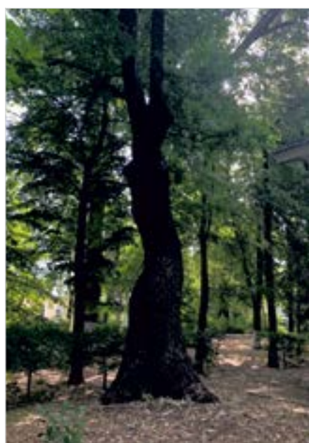
Отделение № 3 Department №3