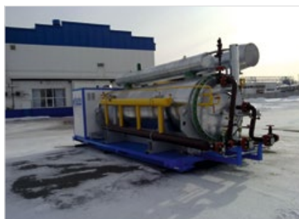
Рис. 1а — Подогреватель ПНГ-050М1 с демульсатором

К особенностям конструкции подогревателей ООО «ТюменНИИгипрогаз» следует отнести то, что они изначально разрабатывались для работы в холодном климате и на неподготовленном газе со скважин. Для этого подогреватели оснащены собственной системой подготовки и редуцирования топливного газа, включающей одну или две ступени редуцирования с фильтрами-сепараторами. Топливный газ имеет подогрев от промежуточного теплоносителя. Подогреватели управляются локальной автоматической системой управления (АСУ) на базе современного промышленного контроллера, позволяющей передавать все параметры работы на верхний уровень АСУТП по интерфейсу RS-485, производить розжиг в ручном или автоматическом режиме (в том числе дистанционный) и управлять работой (степенью нагрева) с верхнего уровня. Узел подготовки топливного газа и локальная АСУ размещаются в отсеках, обогреваемых теплом работающего подогревателя. На время запуска в холодное время года подогреватели имеют систему электрического обогрева отсеков и трубопроводов. На некоторых объектах добычи нефти с наличием растворенного в ней попутного газа выгоднее не устанавливать аппараты по делению попутного газа для подачи его в горелку подогревателя, а отбирать попутный газ непосредственно в самом подогревателе. Для этого разработана модификация