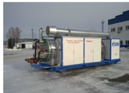
Рис. 1б — Подогреватель ПНГ-050М1

Общая концепция подготовки газа на таких объектах предусматривает применение подогревателя газа как центра обогрева всего