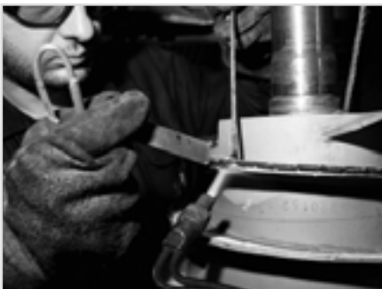
Фото 4 Установка на шнек твердосплавных пластин

Необходимо также отметить, что, как правило, производственные возможности сервисного центра, основная активность которого связана с таким высокотехнологичным оборудованием, как шнековые центрифуги, позволяют данному предприятию ремонтировать и другое достаточно ответственное оборудование заказчиков, что обеспечивает последним определенное удобство сервиса. ■