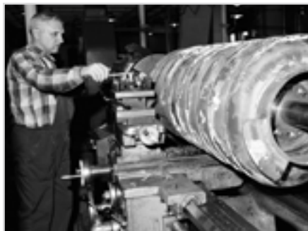
Фото 2 Механическая обработки кромки винтовой плоскости шнека