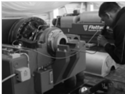
Фото 1 Инспекционный осмотр центрифуги

Порой недостаточная оперативность и гибкость, плохо продуманная логистика, отсутствие должного опыта информационного обмена с иностранными поставщиками приводят к тому, что, особенно на предприятиях коммунального хозяйства, иногда даже ►