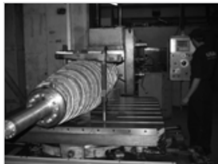
Фото 3 Ремонт центрирующих поверхностей