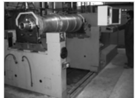
Фото 6 Динамическая балансировка наружного барабана центрифуги