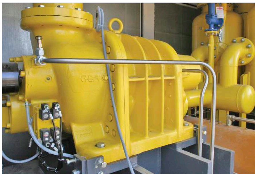
Фото 3 — Винтовой маслозаполненный компрессор

Замена масла MG11 на MG22 нарушила циркуляцию масла в масляной системе во время запуска компрессорных установок после длительной стоянки при отрицательных температурах (ниже -10^{\circ}\text{C} ). Это произошло из-за большой вязкости масла в выносном аппарате воздушного охлаждения (АВО, фото 4). Во избежание такой ситуации было разработано инженерное решение по подогреву масла в АВО во время пуска компрессорной установки.