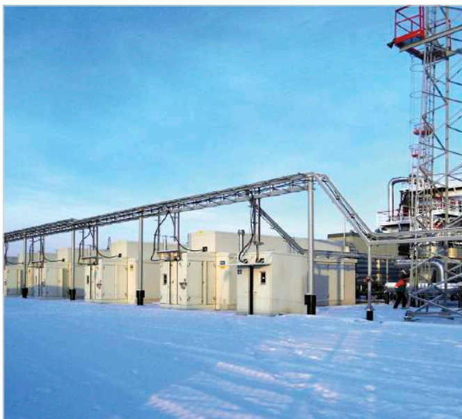
Фото 1 — Компрессорные установки Enerproject типа EGSI-S-650/1500WA для компримирования ПНГ

По специальному заказу изготовили электромеханический привод входного клапана, снабженный пружинным отсекателем. Сложность заключалась в том, что необходимо было вмонтировать, «вписать» данный электропривод в существующий модуль ДКУ, в котором пространство ограничено. Для того чтобы создать момент силы для мгновенного закрытия при аварийной ситуации входного клапана (задвиги) диаметром