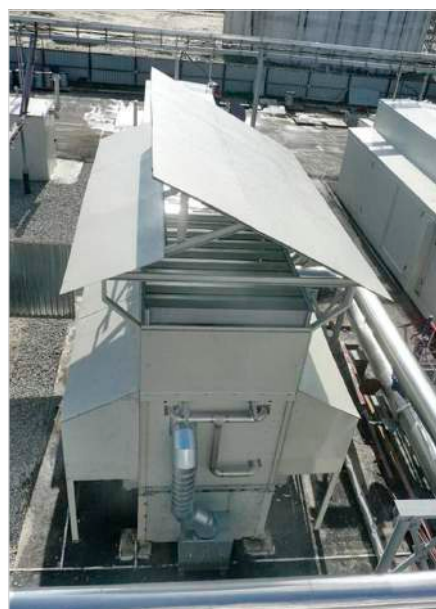
Фото 4 — Аппарат воздушного охлаждения после модернизации системы теплообмена