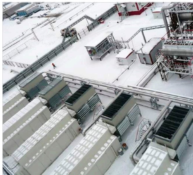
Фото 2 — Дожимная компрессорная станция Алехинского нефтяного месторождения в эксплуатации