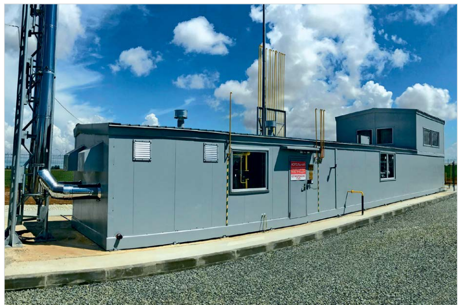
Фото 8 — Автоматизированная газораспределительная станция производства ГК ЭНЕРГАЗ

В марте 2019 года состоялся пуск Прегольской теплоэлектростанции мощностью 455,2 МВт. Это самый крупный объект новой калининградской генерации. ТЭС состоит из четырех парогазовых энергоблоков, каждый из которых включает газовую турбину типа 6F.03 («Русские газовые турбины»), генератор («Элсиб»), паровую турбину («Силовые