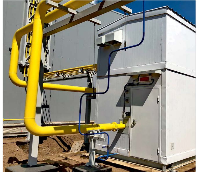
Фото 10 — Блочный пункт очистки газа для ГТУ-ТЭС в Елабуге — компактная установка в базовой комплектации

машины), котел-утилизатор («Подольский машиностроительный завод»).