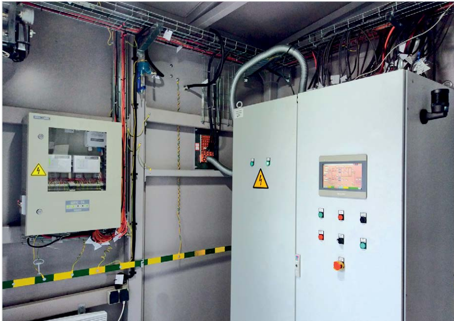
Фото 4 — Отсек САУ комплектной установки

и узлов на панель оператора. Управление оборудованием газоподготовки с центрального щита объекта осуществляется в полном объеме аналогично управлению «по месту».