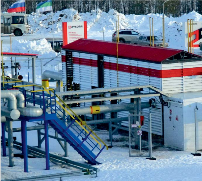
Фото 9 — Блок подготовки попутного газа для ГТУ-ТЭС Усинского месторождения