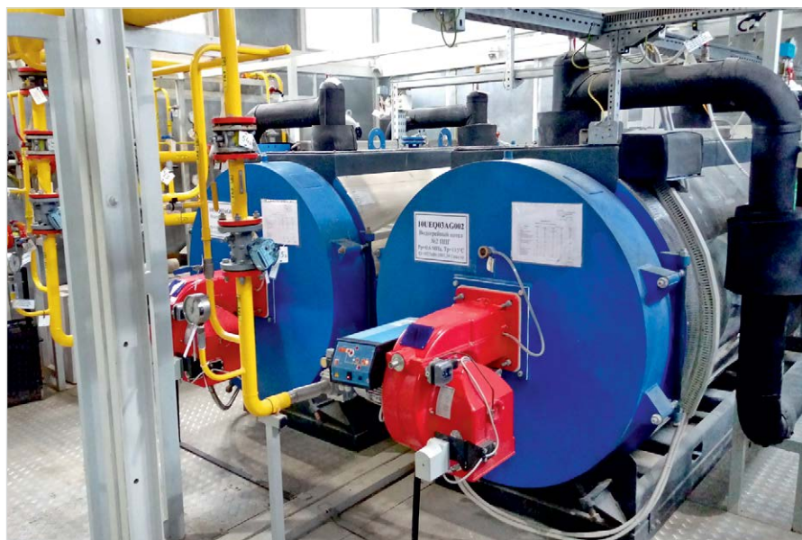
Фото 6 — Отсек блочной котельной встроен в общий технологический модуль

Комплектация АГРС: 2 линии фильтрации с фильтрами-коалесцерами; узел дренажа