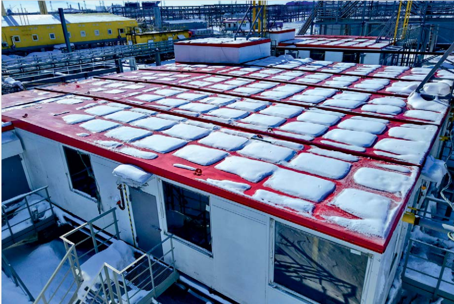
Фото 7 — Многоблочная установка подготовки топливного газа для объектов УКПГиК на Восточном Уренгое

конденсата (с резервуаром 3 м 3 ); 2 измерительные линии с расходомерами ультразвукового типа; 2 кожухотрубных теплообменника; 2 нитки редуцирования; калориметр; анализатор влажности; узел одоризации (с емкостью для хранения одоранта объемом 2,1 м 3 ); система автоматизированного управления; системы жизнеобеспечения и безопасности; резервный генератор.