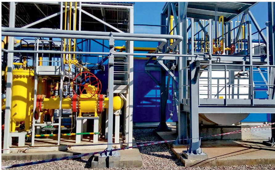
Фото 2 — Внешний блок предварительной фильтрации и узел дренажа конденсата

в оборудовании «ЭНЕРГАЗ» используются двухступенчатые коалесцирующие фильтры со сменными элементами (картриджами). Такие фильтры обеспечивают высокую степень удаления капельной влаги и твердых частиц при расчетном перепаде давления. Также этот метод позволяет менять тип картриджей или их комбинацию для оптимизации эффективности очистки при изменении состава и характеристик поступающего газа.