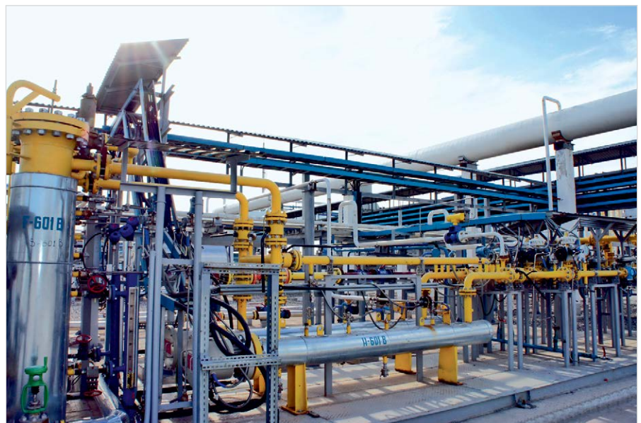
Фото 5 — Система газоподготовки для ДКС «Алан» (Узбекистан). В этой установке используются электрические подогреватели газа

Измерение температуры точки росы газа по воде и углеводородам обеспечивает