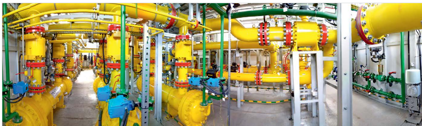
Фото 1 — Технологические отсеки многоблочной установки газоподготовки для Прегольской ТЭС

Газовые фильтры выбираются в зависимости от состава подаваемого на объект газа, а также содержания в нем механических примесей и жидких фракций. Преимущественно