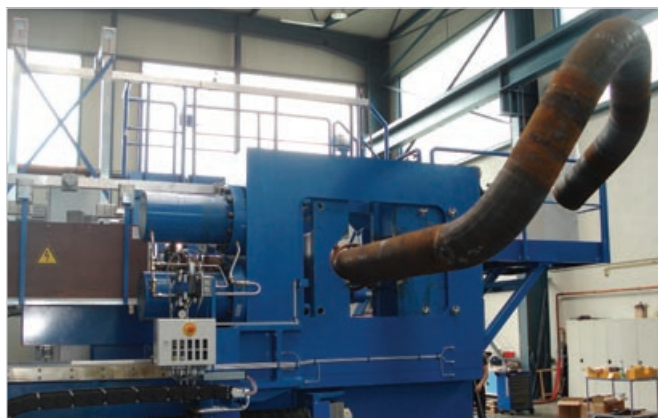
Рис.3 – Трехмерная гибка труб