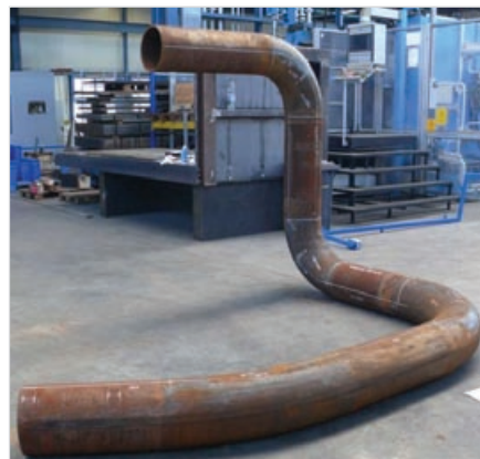
Рис.1 – Трехмерная гибка труб