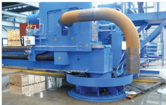
Рис.5 – Изготовление отводов методом горячего гнутья