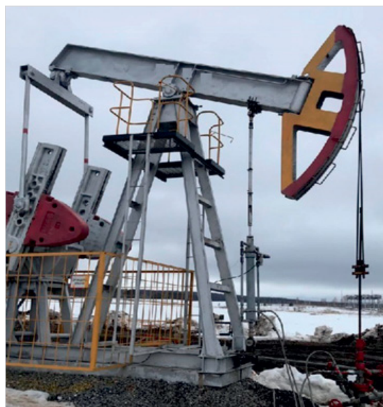
Фото 2. Компрессор скважинный, установленный на скважине