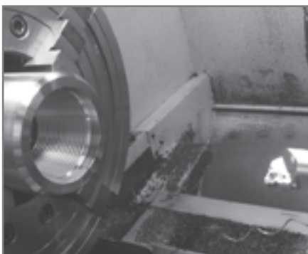
Рис. 1. Процесс нарезания внутренней резьбы