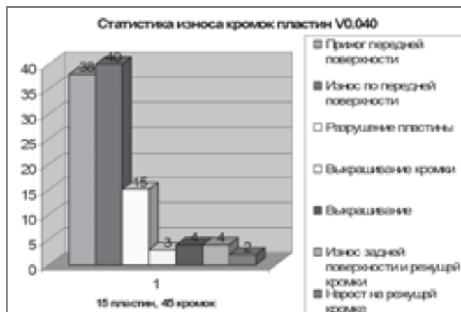
Рис. 4. Статистика износа пластины для нарезания резьбы