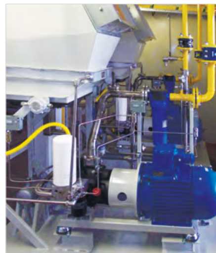
Два дожимных компрессора COMPEX 18 в климатическом исполнении на Боголюбовском нефтяном месторождении, Оренбургская область