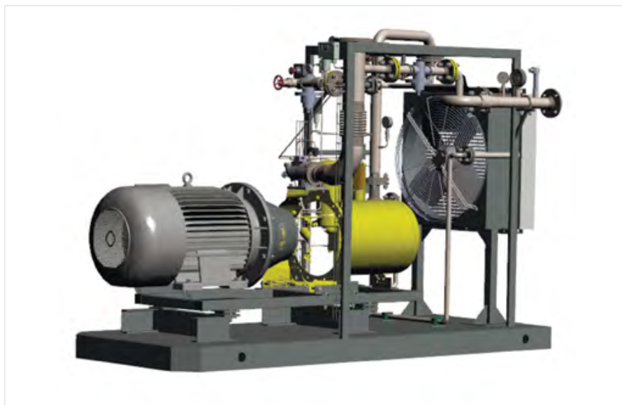
Дожимной компрессор COMPEX 75 на раме

Ценовая политика производителя позволяет говорить о том, что в настоящее время компрессоры COMPEX имеют оптимальное для потребителя сочетание цены и качества, что подтверждается стремительно растущим числом их применений. На сегодняшний день в России и странах СНГ эксплуатируется более сотни дожимных компрессоров COMPEX на объектах крупнейших нефтяных компаний, среди которых НК «Альянс», ОАО НК «РуссНефть», ОАО «ТНК-ВР», ЗАО «ТАТЕХ», ОАО «РИТЭК».