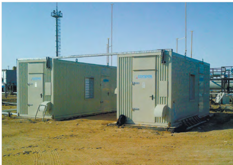
Дожимные компрессоры COMPEX 110 для компримирования попутного нефтяного газа на месторождении «Сарыбулак» — в Казахстане

Развитие нефтегазовой отрасли, имеющей стратегически важное значение для экономики России, базируется на применении современных и надежных технологий. Газовые дожимные компрессоры являются неотъемлемой частью большинства проектов на различных нефтегазовых объектах. Они применяются для сбора и подготовки природного газа, газового конденсата или попутного нефтяного газа для дальнейшей транспортировки. В составе энергоцентров, утилизирующих ПНГ, они используются для подготовки топлива для генераторов, и зачастую от бесперебойной работы компрессоров зависит устойчивое функционирование всего объекта.