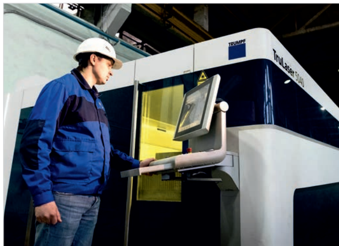
Фото 4 и 5. Освоение новой серии энергоэффективных ЭД потребовало модернизации станочного парка

не единичный случай. Напомним, что в Европе уже действуют нормы класса энергоэффективности IE3 (требуемый КПД для этих двигателей составляет 87,7%).