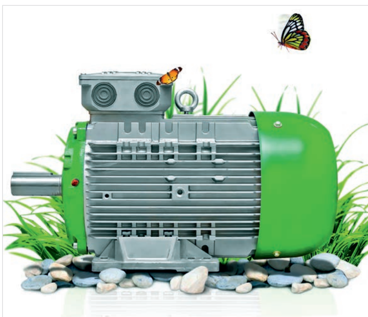
Рисунок. Электродвигатели серии 7AVE — экономичные, экологичные, энергоэффективные

Нетрудно подсчитать, что дополнительная стоимость двигателя за счет экономии электроэнергии окупается за 14–18 месяцев. С учетом стоимости установленной мощности, окупаемость наступает уже при покупке,