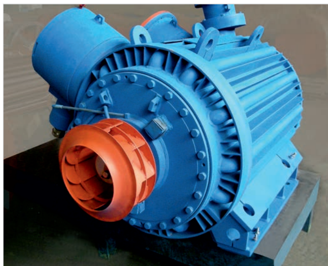
Фото 2. Асинхронный двигатель с пониженным уровнем шума и вентилятором нового типа

Так совсем недавно в наш сертифицированный Испытательный Центр обратился отечественный производитель вентиляторов, который приобрел такие двигатели, с целью определения фактического уровня энергоэффективности. Испытания показали, что двигатели мощностью 3,0 кВт при норме КПД самого низкого класса энергоэффективности IE1 81,5% имели КПД 74,5%. В результате после 2-х часовой работы из-за повышенных потерь температура обмотки статора превысила 140°C — двигатель пришлось отключить. Это