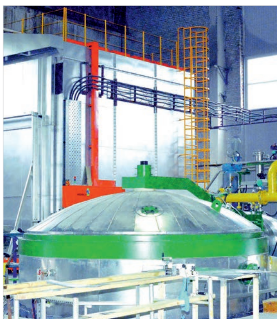
Фото 1. Вакуумно-нагнетательный пропиточный комплекс «Монолит» для изоляции компонентов электрических машин