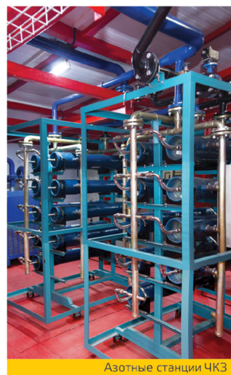
Азотные станции ЧКЗ

К одному из них можно отнести недавно выигранный конкурс, объявленный ОАО «АК «Транснефть» на поставку трех азотных станций на базе шасси грузовых автомобилей. Грамотное техническое решение, мобильность, удобство эксплуатации и надежность оборудования, а также привлекательная цена определили победу ЧКЗ в конкурсе на поставку.