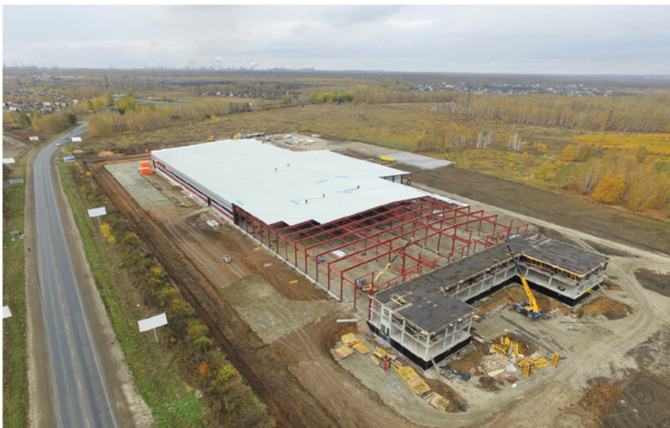
Строительство нового завода

По результатам эксплуатации компрессорных установок ООО «ЧКЗ» получил отличный отзыв от ООО «Запсибгазпром-Газификация». Клиент доволен надежностью и работоспособностью челябинских компрессоров в условиях Крайнего Севера.