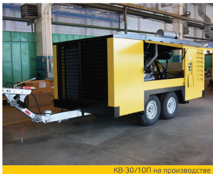
КВ-30/10П на производстве