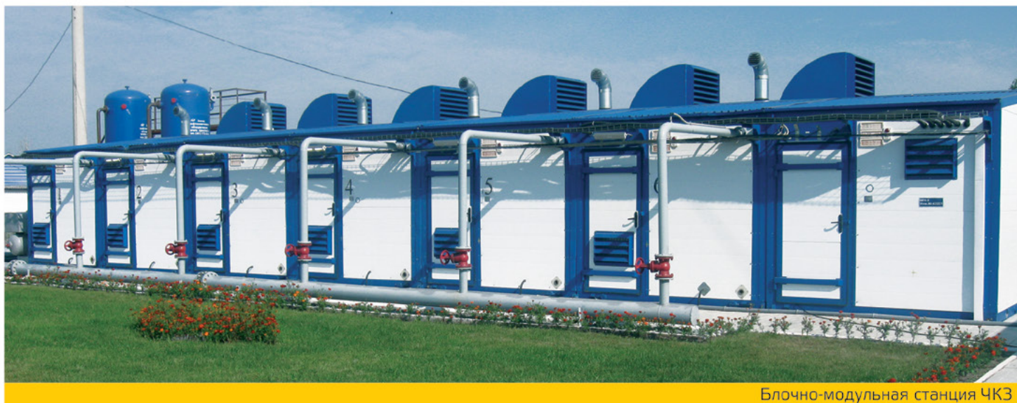
Блочно-модульная станция ЧКЗ

454085, Челябинск, пр. Ленина, 2Б, а/я 8814 +7 (351) 775-10-20 zavod@chkz.ru www.chkz.ru