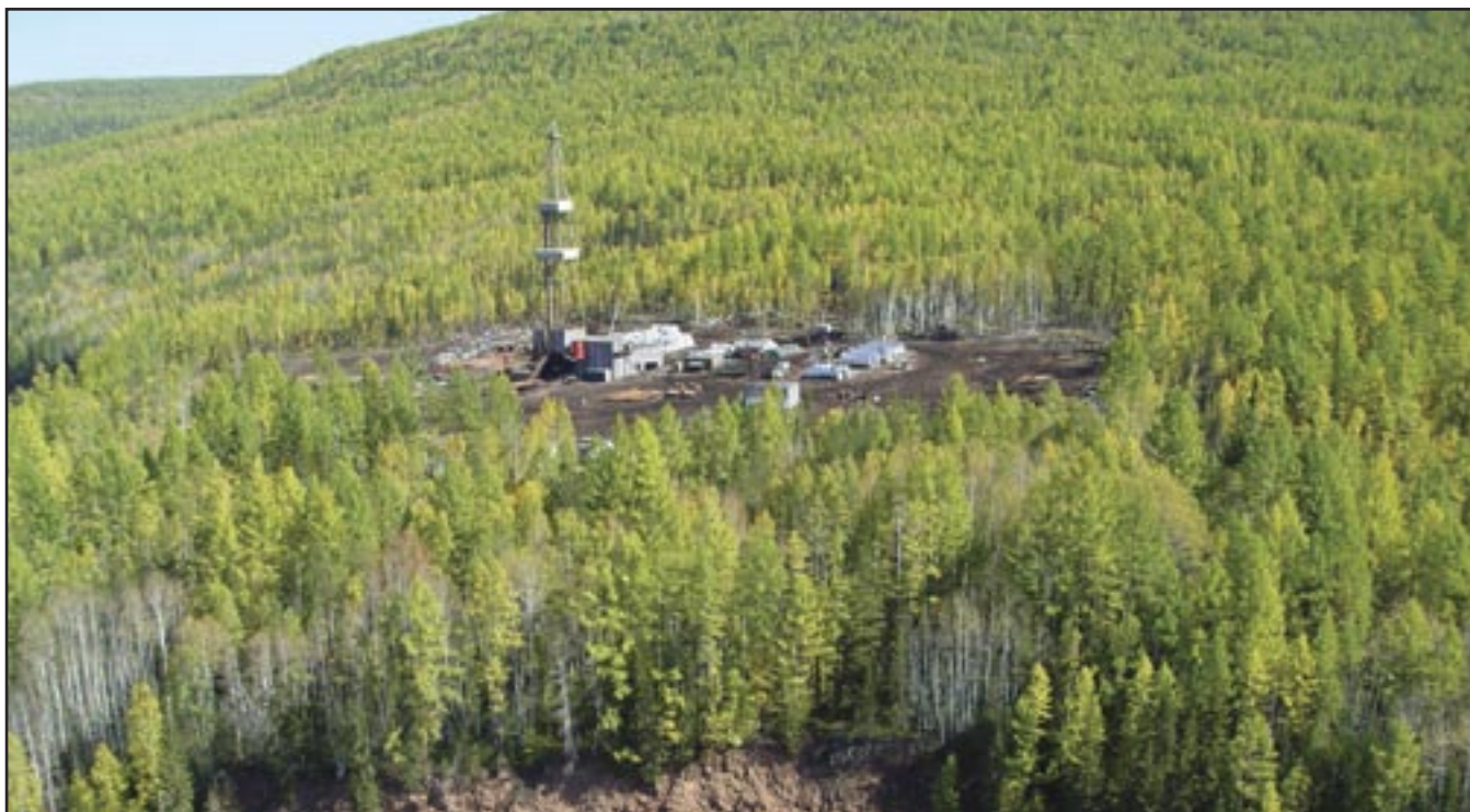
Рис. 2. Скважина №1

нефтехимической продукции, а возможно, и электроэнергии могут быть организованы после 2018 года.