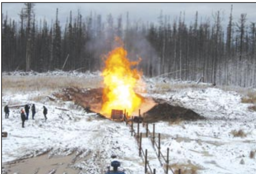
Рис. 3. Скважина № 6 в процессе испытания

В современных условиях усиления экономической и геополитической роли АТР в мире именно экономическое развитие восточных регионов России, в том числе за счет реализации крупных нефтегазовых проектов, позволит нашей стране сохранить территориальную целостность и занять достойное место в новом международном порядке. Компания «Петромир» готова к встрече с новыми глобальными вызовами, работая на будущее России. ■