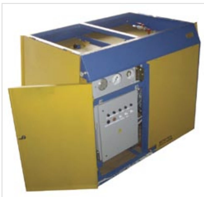
Рис. 1 Малогабаритная электрическая парогенераторная установка (МЭПУ)

ООО НПФ «Синтез» 625013, г. Тюмень, ул. 50 лет Октября, 118, к. 710 Почтовый адрес: 625000, г. Тюмень, Главпочтамт, а/я 763 Тел./факс: (3452) 41-78-20, 32-36-86, 32-34-14, 32-39-78, моб. 73-16-83 sintez1@newmail.ru www.neftgazprogress.ru