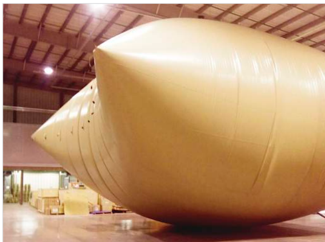
Рис. 2 — Проверка на прочность полимерного эластичного резервуара

ООО НПФ «Политехника» 109383 Москва, ул. Шоссейная, 110В. Тел./факсы: +7 (495) 783-01-67, 783-01-68 E-mail: info@poli.ru