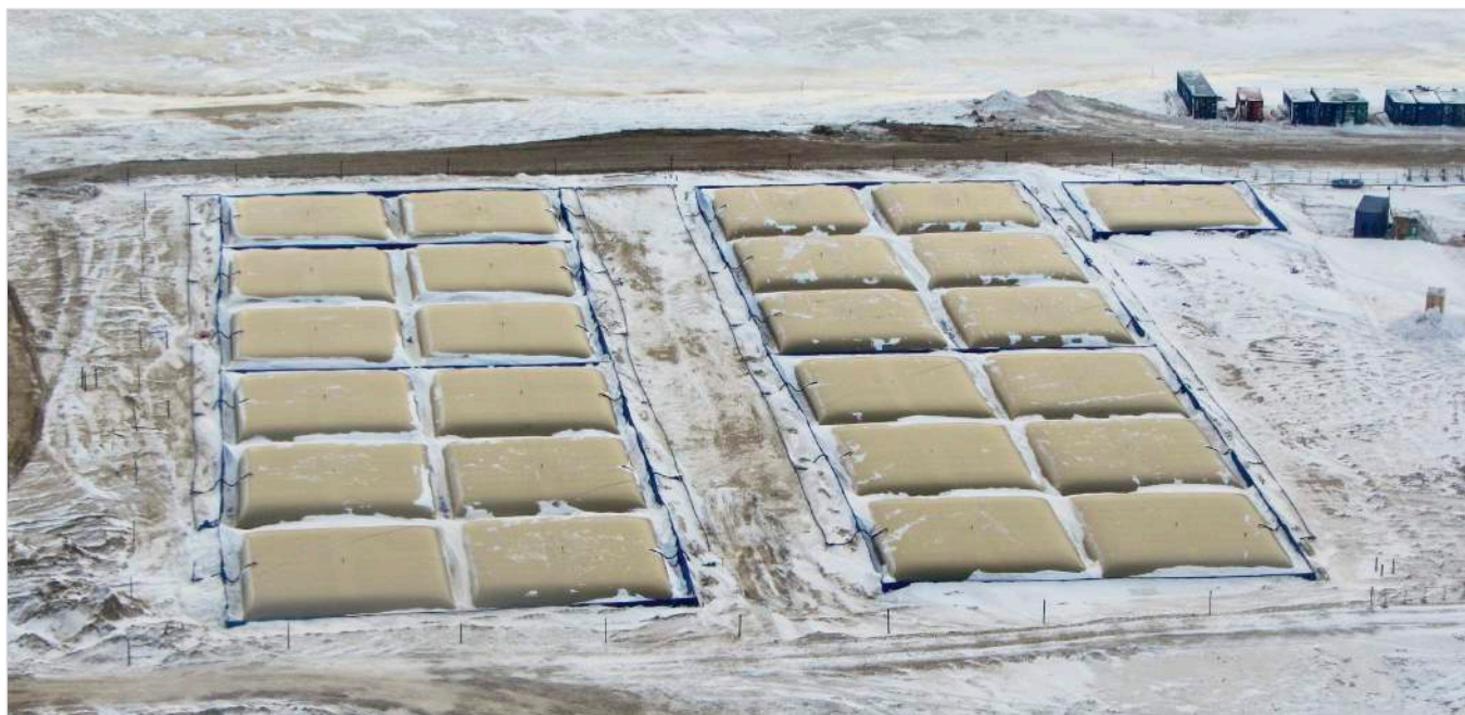
Рис. 1 — Полимерный эластичный резервуар с вертолета

В месте проведения работ по их завершении не остается полупорожних резервуаров и бочек, которые являются опасным источником