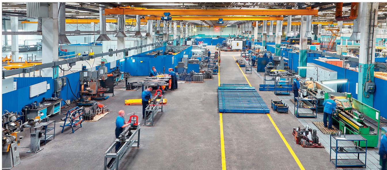
Рис. 1 — Производственная площадка в г. Нефтекамск

Конкурентоспособность предприятия основывается на высоком уровне управления производством и повышенном внимании к выполнению каждой технологической операции. Но главное — это знание и опыт сотрудников завода — лучших специалистов в своей области, непрерывно повышающих уровень своей квалификации. Сочетание научно-технической базы и прогрессивных технологий дает возможность выпускать пакерно-якорное оборудование на уровне лучших мировых образцов при конкурентных на рынке ценах.