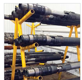
Сервисный центр г. Нижневартовск