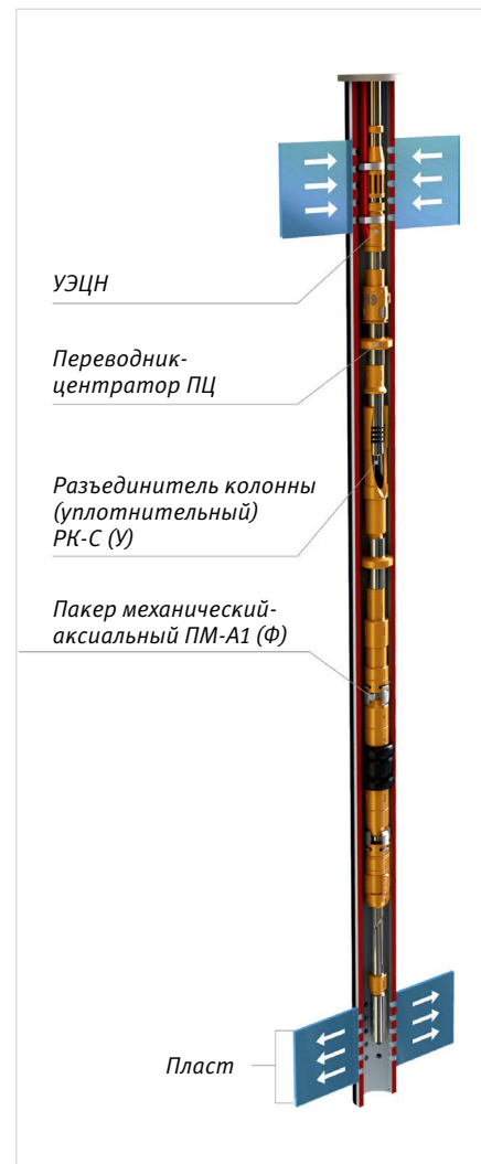
Рис. 8 — КОУС-ПК (А) К-УГ для внутрискважинной перекачки с верхнего интервала водозабора в нижний