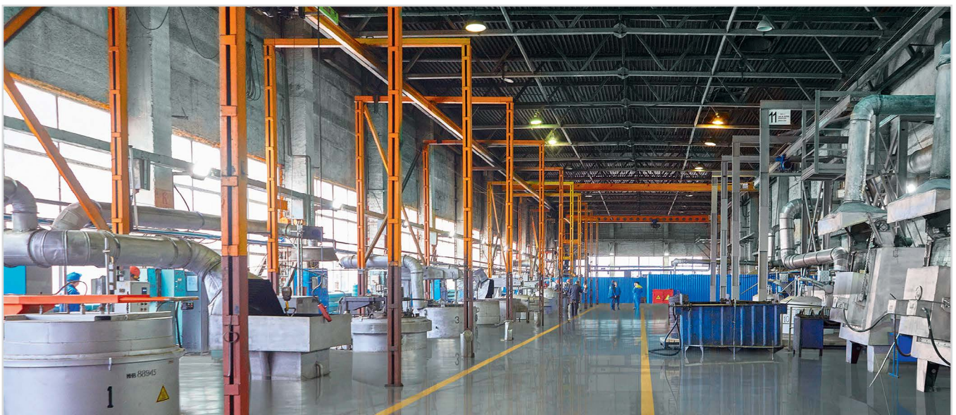
Рис. 5 — Термолитейный цех

Разрабатываемое и выпускаемое оборудование применяется в компоновках для ОРЭ — современного способа эксплуатации скважин, позволяющей вести добычу нефти и газа из двух и более пластов одной скважины, организовывать раздельную закачку жидкости в несколько интервалов. Таким образом сокращаются затраты на разбуривание и обустройство месторождений. Оборудование имеет конструктивные особенности, позволяющие вести учет каждого продуктивного пласта в процессе добычи и/или закачке жидкости.