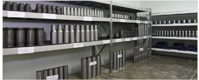
Рис. 4 — Склад комплектующих