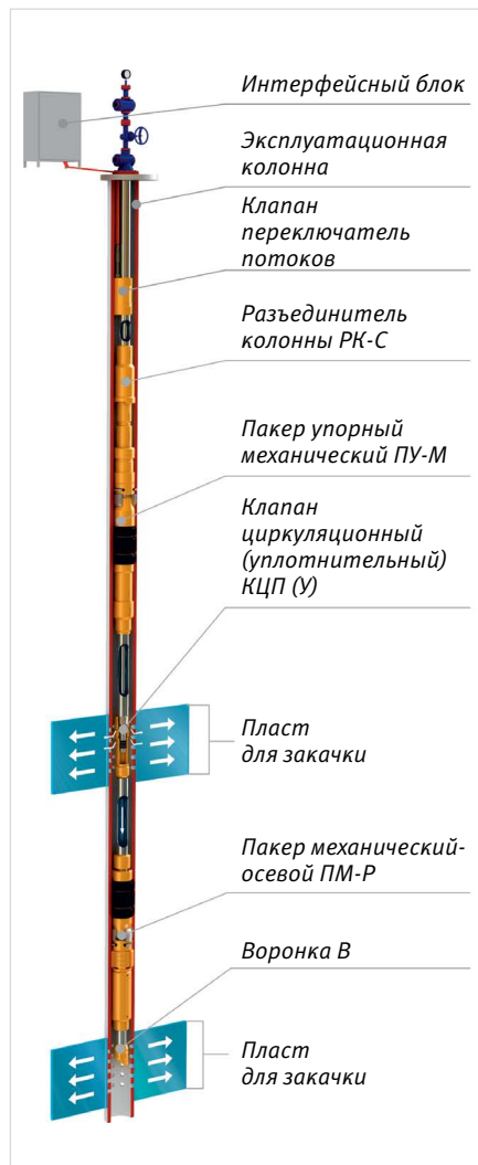
Рис. 7 — КОУС-ДПК-ОРЗ (КП) для одновременно-раздельной закачки жидкости с клапаном переключателем потоков