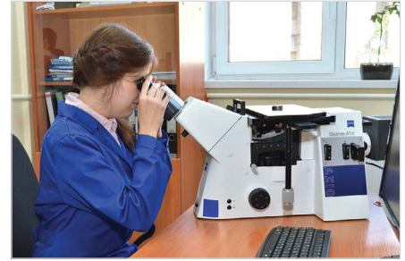
Рис. 14 — Анализ структуры металла