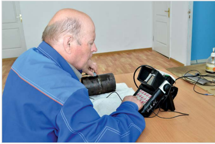
Рис. 12 — Ультразвуковой контроль