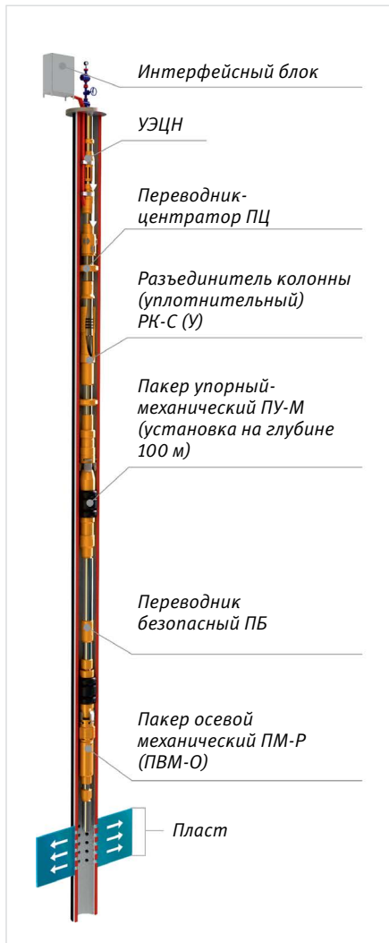
Рис. 9 — КОУС-ДПК (А) К-УГ для дожима жидкости, подаваемой с водовода по схеме «сверху-вниз» и защиты эксплуатационной колонны