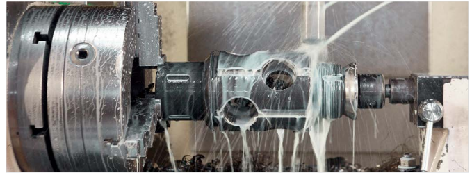
Рис. 3 — Механическая обработка якоря гидравлического