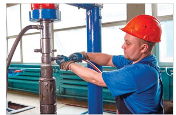
Сервисный центр г. Нефтекамск