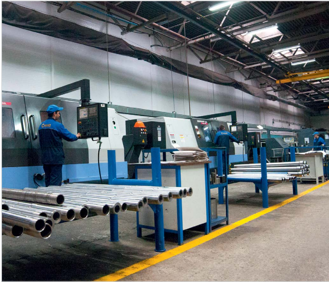
Рис. 2 — Обрабатывающие центры