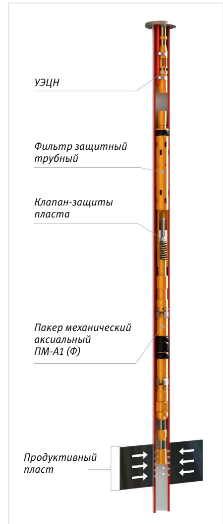
Рис. 11 — КОУС ПМ-А1(Ф)-КО для эксплуатации скважин механизированным способом и защиты призабойной зоны пласта

традиционными способами и в условиях нынешней стоимости нефти специалисты добывающих компаний посчитали, что на глушение скважин при смене глубинно-насосного оборудования тратятся колоссальные средства, а потери базового дебита на запуске велики.