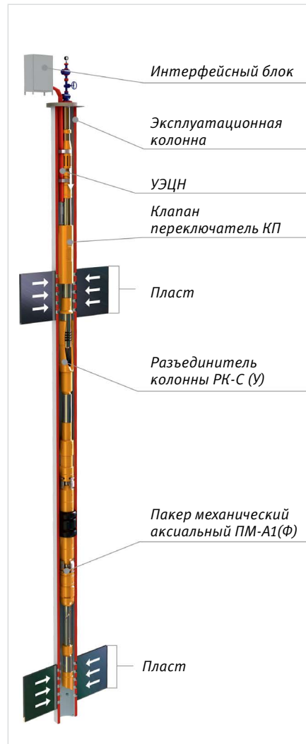
Рис. 10 — КОУС-ПК-ОРД (КП) М для одновременно-раздельной добычи жидкости из двух пластов одним УЭЦН