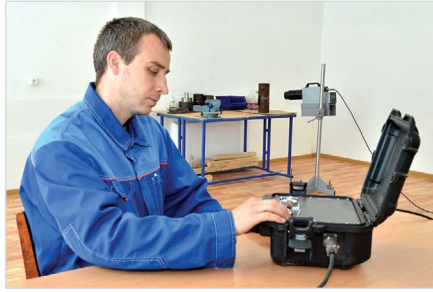
Рис. 13 — Рентгенографический контроль