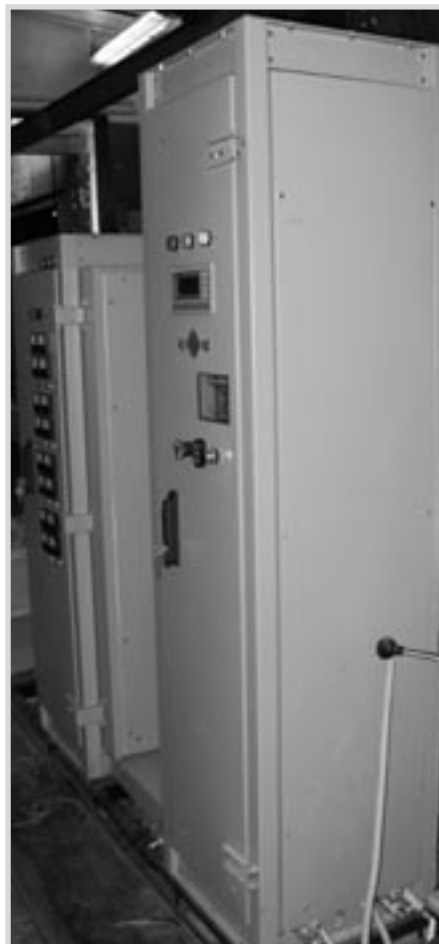
Рис. 3. Внешний вид установки