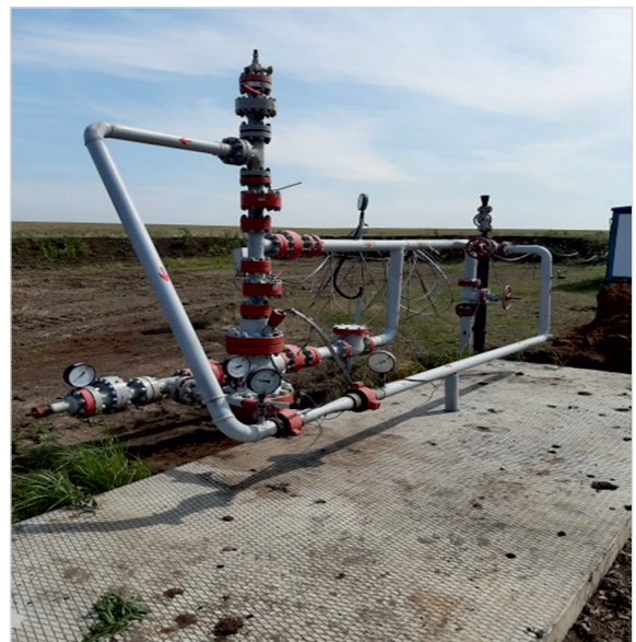
Фото 1. УСУ в устье обвязке скважины