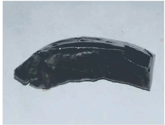
Рис. 4 — Керн, выдержанный в дисперсионной среде со смесью неорганических ингибиторов (пластовая вода, содержащая соли натрия, кальция и калия хлористого) и органического ингибитора (одного из испытуемых)

Fig. 3 — Core matured in reservoir water (in a dispersion medium with a mixture of inorganic inhibitors-sodium, calcium, and potassium chloride)