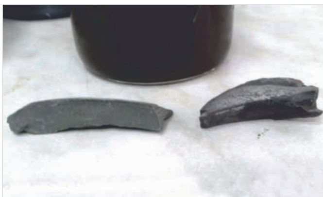
Рис. 1 — Керн (исходный материал), не подвергнутый смачиванию дисперсионной средой Fig. 1 — Core (source material) not wetted with a dispersion medium

Однако, детальных исследований в лабораторных условиях не проводилось, те или иные способы ингибирования (либо те или иные ингибиторы) сразу испытывались в промысловых условиях и далеко не всегда был виден практический результат ввода их в состав рецептур буровых растворов. Поэтому встал вопрос о лабораторных испытаниях, в ходе которых было запланировано найти оптимальный вариант ингибирования