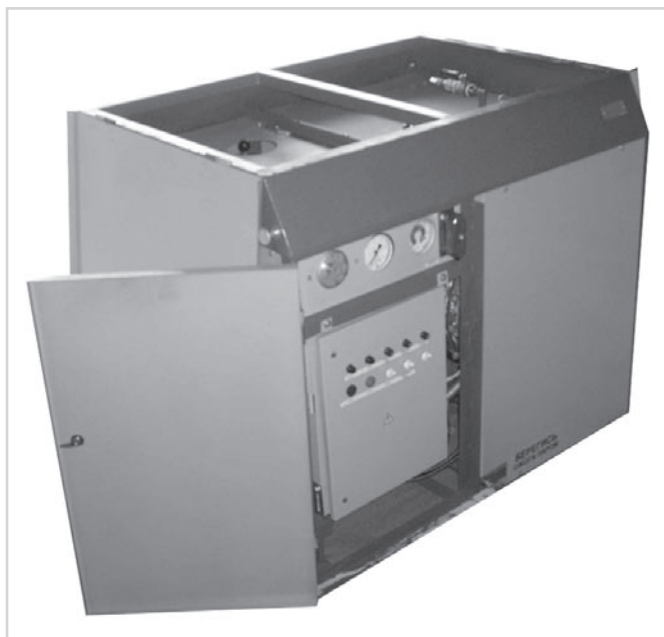
Рис. 1 Малогабаритная электрическая парогенераторная установка (МЭПУ)

ООО НПФ «Синтез» 625013, г. Тюмень, ул. 50 лет Октября, 118, к. 710 Почтовый адрес: 625000, г. Тюмень, Главпочтамт, а/я 763 Тел./факс: (3452) 41-78-20, 32-36-86, 32-34-14, 32-39-78, моб. 73-16-83 sintez1@newmail.ru www.neftegazprogress.ru